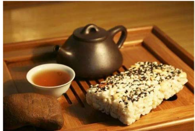
米花糖(ミーファータン)

都城市の友好交流都市である重慶市江津区の「米花糖」が最も有名で、中国人の伝統的なおやつとして愛されています。11月24日の午後、MJホールで開催される友好交流都市20周年記念式典では、お土産として特別に江津区の米菓子を取り寄せました。皆さんもぜひいらして、味見してみてください！