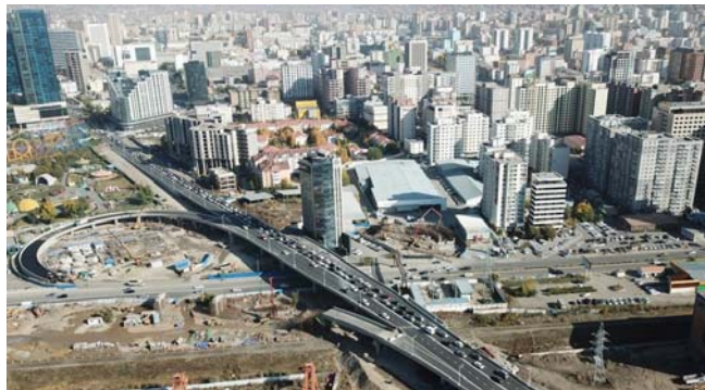
現在のウランバートル市

毎年10月29日は、モンゴルの首都ウランバートル市民にとって、住んでいる町の“Happy Birthday”の日です。今年、ウランバートル市誕生380周年を祝う特別な年で、ウランバートルでは、市内の地区や区のインフラ整備改善事業、市民向けの様々なイベントや祭りを企画しています。