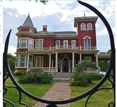
スティーヴン・キング生家

都城市に来て、皆さんのおもてなしや優しさに心から感謝し、この市をもっと探検するのを楽しみにしています!