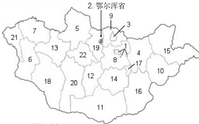
蒙古国各省市分布地图