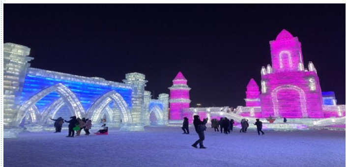
哈尔滨国际冰雪节

标志性建筑，还能进到里面参观。终于，来到了期待已久的冰雪节现场。让我们很惊讶的是，明明已经提前很早到了，但是已经有许多人聚在那里。整个会场是在室外举办的，气温为零下30度，一呼气睫毛和眉毛都会结上霜。当然，进那里之前一定要穿得厚厚的。进入广阔的现场，首先就有许多冰雕，还有超过100米长的巨大冰雕滑梯（这也是最受欢迎的）、乘坐冰雕马车、挑战冰雕迷宫，每一样都十分好玩。看着这些巨大的冰雕建筑，仿佛置身在“冰雪奇缘”的世界。冰雕还被照上了LED灯，又变成了多彩奇幻的世界，看着这些美妙的景象连寒冷都忘却了。建造这样一个冰