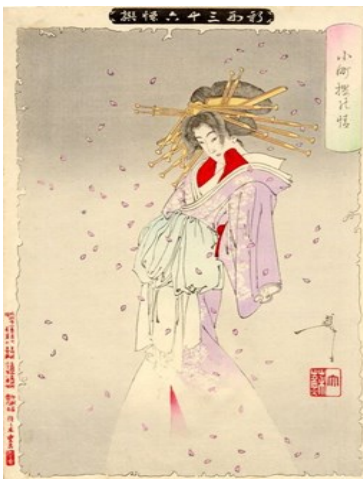
月冈芳年浮世绘作品之一、「美女小野小町の櫻之情」(1889年)