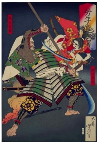
月冈芳年的浮世绘作品之一 「芳年武者无类」、「源牛若丸·熊坂长范」(1883)

了他们。芳年通过学习他老师收藏的外国印刷作品和版画，学习了西方风格的绘画元素、技巧和透视。这使他的版画风格与传统浮世绘不同，他的版画有着充满活力的姿势和逼真的细节。