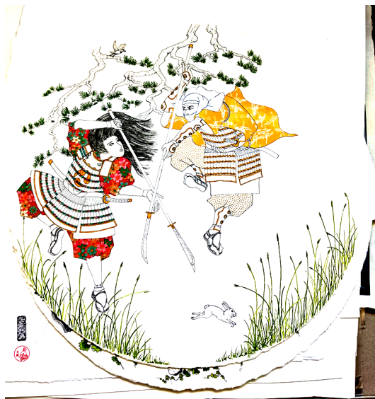
彼得·李的手绘绘画作品！

在我的空闲时间，我会创作自己的绘画，灵感来自月冈芳年和其他浮世绘艺术家。我试图通过使用和纸和珠子等多样的材料来捕捉原始木料的材质的“必须要亲眼才能看得出”的感觉。可惜我没有数百小时的时间或技能来雕刻木块，所以我现在将坚持画画！