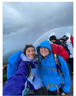
雨后湿透的罗宾和朋友

能派上用场了。如果你必须携带重达3公斤的雨具，那你肯定会想至少要用上一次。走出云雨接着就是一道美丽的彩虹。徒步登山的大部分时间都是一段坚实的上坡路（大约8小时），然后仿佛从地狱往下走的碎石路大约需要3.5小时。我的大脚趾指甲已经脱落表示抗议，我仍然在等待它的回归。